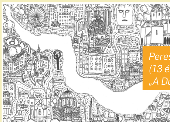
Peresztegi Hanna (13 éves) Budapest – „A Duna mentén”