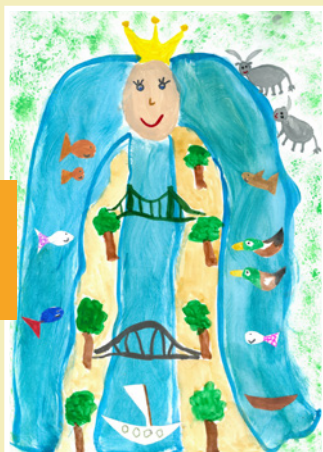
Szabó Zselyke (7 éves) Mohács – „A folyók királynője”